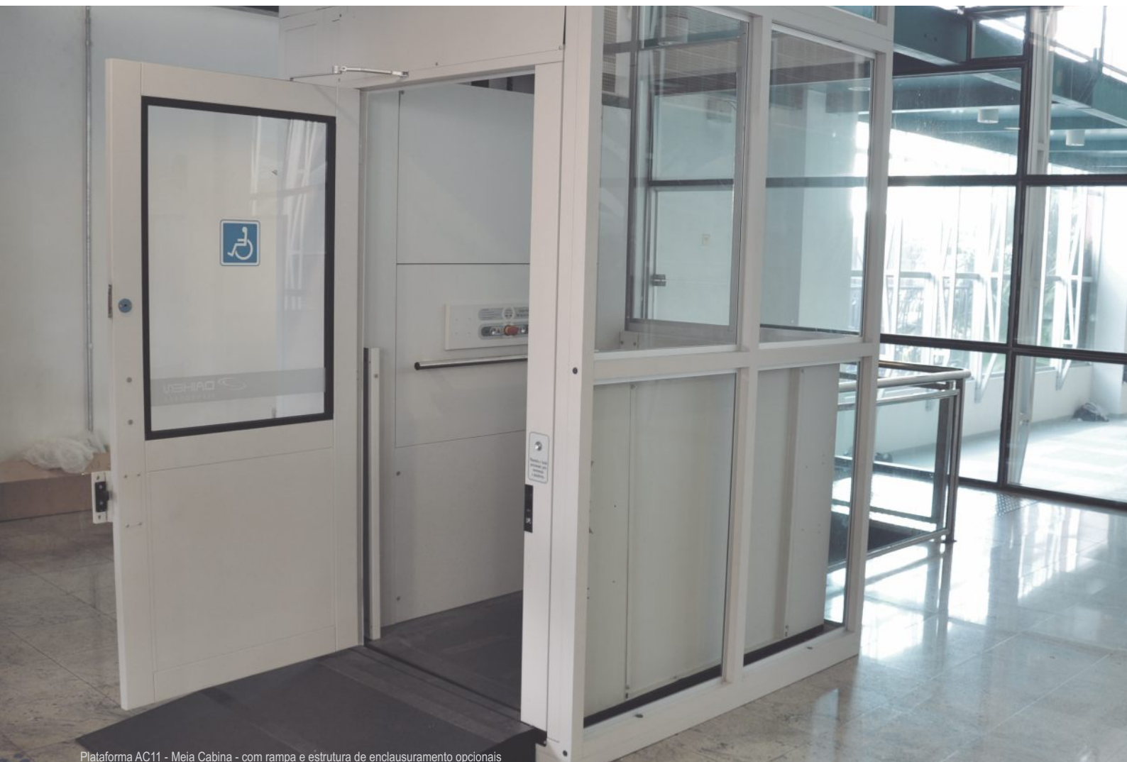
Plataforma AC11 - Meia Cabina - com rampa e estrutura de enclausuramento opcionais