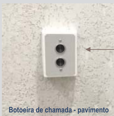
Botão de chamada - pavimento