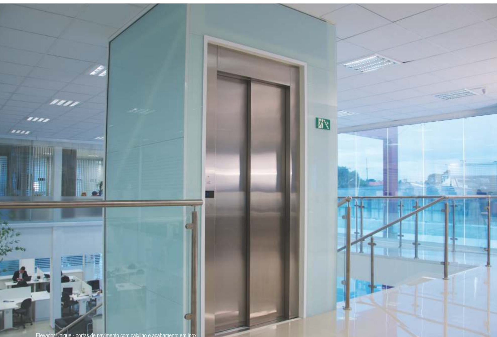
Elevador Unique - portas de pavimento com caixilho e acabamento em inox